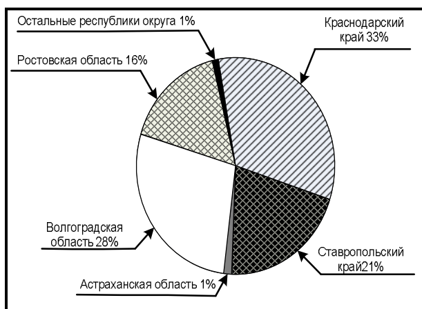
Рис. 1. Структура поставок нефтепродуктов по субъектам ЮФО

Анализ поставок нефтепродуктов по потребителям показывает, что это произошло из-за резкого сокращения поставок этих видов топлива сельхозпроизводителям ЮФО. По автобензину поставки сократились в 1,5 раза, а по дизельному топливу – в 2 раза.