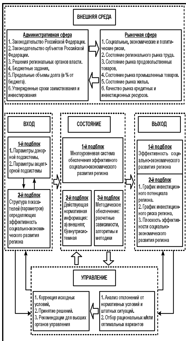
Рис. 3.1. Принципиальная схема эффективного управления социально-экономическим развитием региона

рактера управления территориальным образованием и рыночным характером функционирования субъекта.