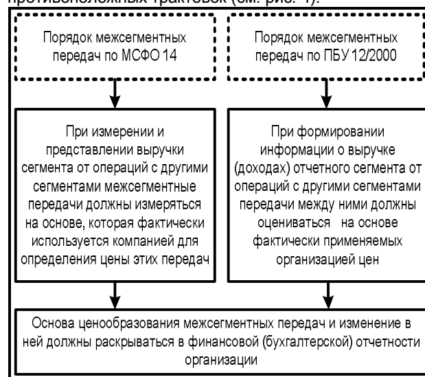
Рис. 4. Сравнительный анализ порядка ценообразования межсегментных передач по МСФО 14 ПБУ 12/2000

В отдельный пункт программы аудита сегментной отчетности, по нашему мнению, необходимо выделить проверку правильности выбора цен при межсегментных передачах, от которого зависит формирование показателя «выручка сегмента». Требование к порядку ценообразования изложено в международном и отечественном стандарте таким образом, что при идентичном, на первый взгляд, содержании дает возможность противоположных трактовок (см. рис. 4).