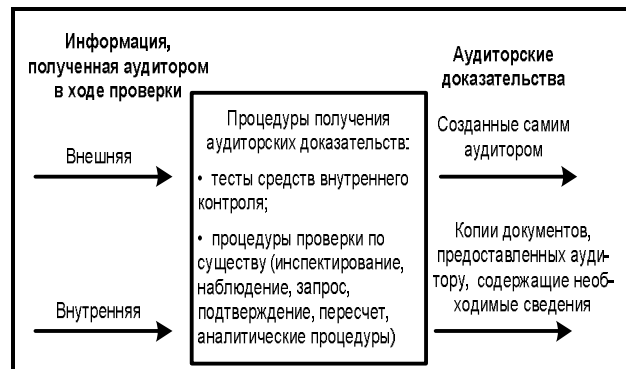
Рис. 2. Процесс получения аудиторских доказательств

Проиллюстрируем процесс получения аудиторских доказательств следующим образом (см. рис. 2).