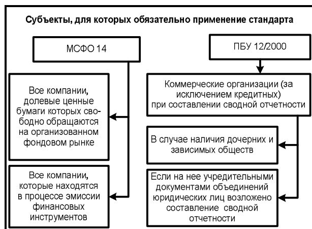
Рис. 1. Сравнительный анализ МСФО 14 «Сегментная отчетность» и ПБУ 12/2000 «Сегментная отчетность»

Необходимо отметить, что при порою дословном соответствии отечественного стандарта международному, между ними существует несколько существенных различий, о которых должен помнить аудитор, проводящий аудит как в соответствии с МСФО, так и ПБУ. Представим первое из них (см. рис. 1).