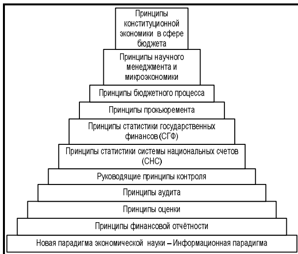
Рис. 3. Иерархия ключевых принципов сферы методологических и методических основ отчетности и аудита в системе государственных закупок

Анализ и проектирование рационального запроса на организованные данные для информационного обеспечения, ориентированного на управление расходами бюджета в сфере государственных и муниципальных заказов, включая такие элементы указанного обеспечения, как финансовая отчетность и аудит, невозможен без учета некоторых базовых принципов бюджетной политики. В силу своей важности такие принципы обычно законодательно закрепляются в конституциях государств, реже – в других законодательных актах. Перечисление всех принципов конституционной экономики в сфере бюджета для целей данной работы не представляется возможным и необходимым. Непосредственно важны для исследования информационного обеспечения вопросов бюджетных расходов в системе государственных заказов следующие принципы: