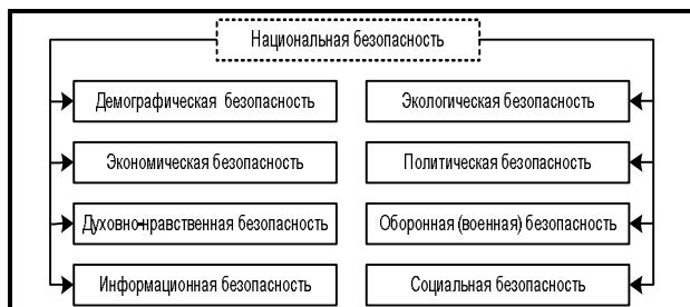
Рис. 2. Структура национальной безопасности