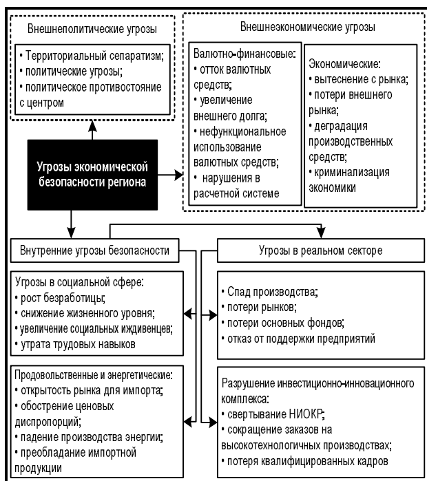
Рис. 1. Классификация угроз региональной экономической безопасности

обходимых средств), то в качестве угроз будут выступать именно упомянутые факторы, а не слабость агропромышленного комплекса как таковая. То же самое относится к большому числу проблем безопасности доступа к рынкам сырья и технологий: угрозой представляет не отсутствие соответствующих производств в национальной экономике (пресловутая «зависимость от международного рынка»), а факторы, способные помешать приобретению соответствующих продуктов и технологий. Это, разумеется, не означает, что на слабости не надо обращать внимания (именно в силу того, что они делают систему открытой для угроз), но их нельзя отождествлять с самими угрозами [4, с. 39].