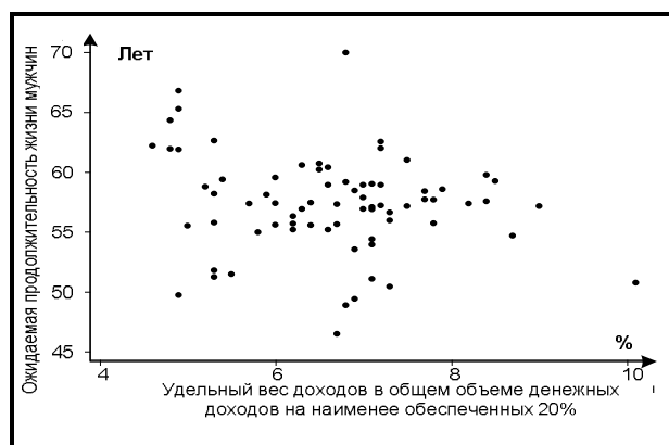
Рис. 3. Взаимосвязь между продолжительностью жизни мужчин и долей в общем объеме денежных доходов наименее обеспеченной 20% группы населения в регионах Севера 5