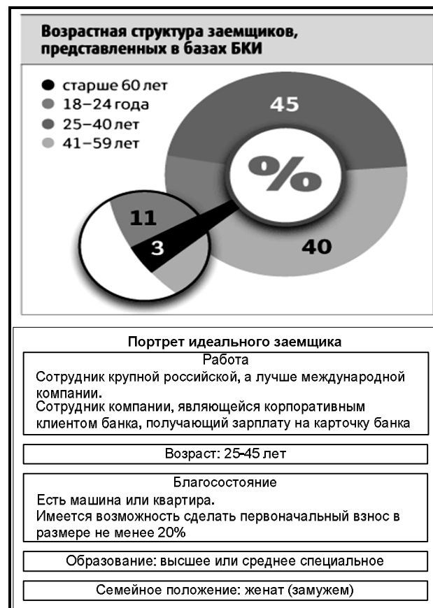
Рис. 1. Характеристики российских заемщиков

Кредитная история заемщика является одним из важных показателей при принятии банком решения о выдаче кредита, но носит скорее справочный характер. Ключевую роль в оценке заемщика играет его платежеспособность. Кроме того у каждого банка есть свои черные списки заемщиков. В них попадают те, кто отличался неадекватным поведением, либо имели проблемы с выплатой по предыдущему кредиту или вовсе не выплатили его. Тем не менее, единого для всех понятия «хорошая кредитная история» не существует. Портрет идеального заемщика и возрастная структура заемщиков в БКИ представлены на рис. 1.