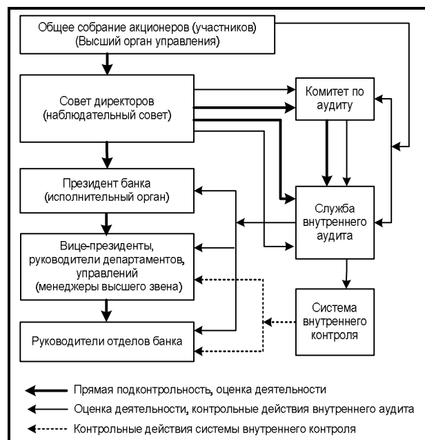
Рис. 2. Место внутреннего аудита и системы внутреннего контроля в управлении коммерческим банком

Сравнительная характеристика отдельных видов контроля в коммерческих банках приводится в табл. 3.