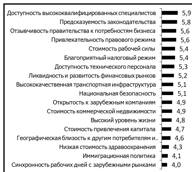
Рис. 1. Наиболее важные факторы в деятельности финансового сектора [24]

денег и финансовых центров. Деньги как мера стоимости не смогут существовать в разрозненном мире, лишённым затрат на информационные и транзакционные издержки. Схожим образом, контрагенты осуществляют финансовые транзакции в финансовом центре вместо широкой сети региональных рынков с целью экономии на стоимости транзакций и информации [17].