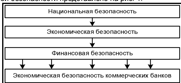
Рис. 1. Экономическая безопасность коммерческих банков в системе национальной безопасности

В концепциях экономической безопасности разрабатываемых научными институтами, рассматривается финансовая безопасность, которая понимается как обеспечение защиты финансовых интересов субъектов народного хозяйства на всех уровнях финансовых отношений граждан и организаций как внутри, так и вне государства, а также их защита от негативных макроэкономических и политических факторов. Критериями для определения уровня финансовой безопасности можно считать стабильность, сбалансированное развитие финансовой, денежно-кредитной, валютной, банковской, бюджетной, налоговой, расчетной, инвестиционной и фондовой систем. Следовательно, в рамках определения финансовой безопасности, как одной из составляющих безопасности экономической, можно говорить о банковской системе, поэтому безопасность банка входит в содержание финансовой безопасности экономики. Место экономической безопасности коммерческого банка в системе национальной безопасности представлено на рис. 1.