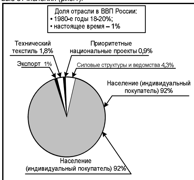
Рис. 1. Потребители продукции легкой промышленности

Поэтому сегодня перед швейной промышленностью стоят новые задачи, решение которых требует новых подходов не только на краткосрочную, но и на долгосрочную перспективу. При этом существенно возрастает роль швейной промышленности в формировании и наполнении внутреннего рынка отечественной продукцией в условиях открытости российского рынка при вхождении РФ в ВТО. Технологически законченный и взаимоувязанный промышленный комплекс (от процесса глубокой переработки сырья до выпуска готовой продукции) способен вырабатывать современный ассортимент продукции массового потребления из натурального и химического сырья и различных их смесовых сочетаний. Особенностью швейной промышленности является высокая мобильность производства, позволяющая предприятиям осуществлять быструю смену ассортимента продукции при любых конъюнктурных изменениях рынка, связанных с сезонными изменениями спроса и моды, не уменьшая при этом объемы выпуска и, соответственно, объемы продаж, не снижая налоговые отчисления (рис.1).