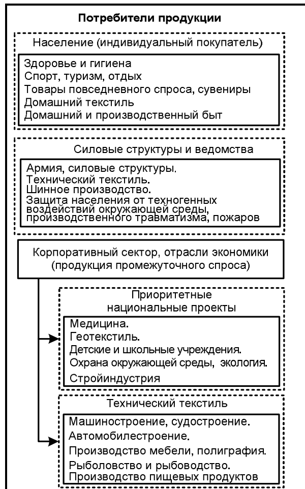
Рис. 2. Области применения и структура потребления продукции легкой промышленности

Продукция швейной промышленности имеет устойчивый спрос и востребована во многих сферах жизнедеятельности человека и оказывает непосредственное влияние на здоровое развитие общества. Основными потребителями продукции в секторе товаров конечного спроса являются индивидуальные покупатели, где на них приходится около 92% производимой продукции (рис. 1 и 2).