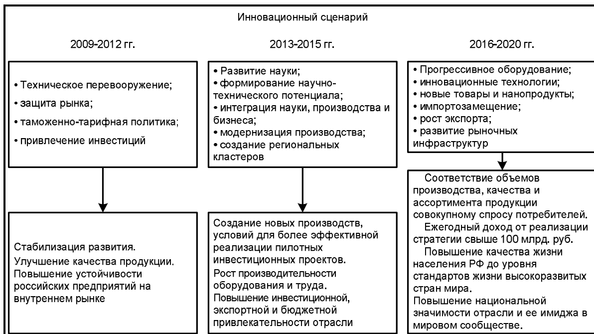
Рис. 5. Второй вариант развития легкой промышленности