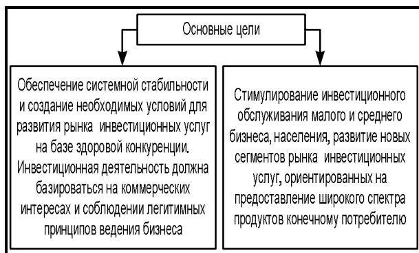
Рис. 1. Основные цели государственной политики в отношении ТЭК

В целом обеспечение государством условий для инвестиционного развития предприятий ТЭК необходимо осуществлять по четырем основным направлениям: