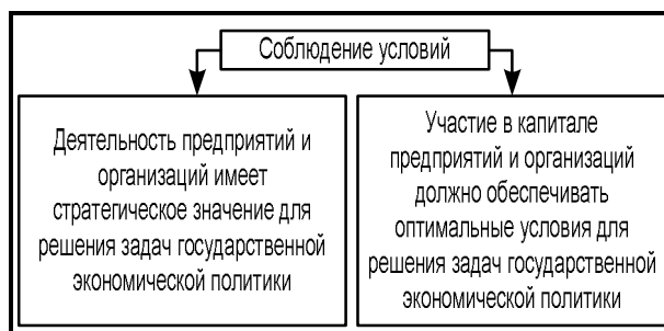
Рис. 2. Соблюдение условий участия Правительства РФ и Минэнерго РФ в капитале предприятий и организаций

Задачи, устанавливаемые для контролируемых государством предприятий и организаций в рамках проводимой государственной экономической политики, не должны входить в противоречие с задачами получения ими прибыли и поддержания их финансовой устойчивости.