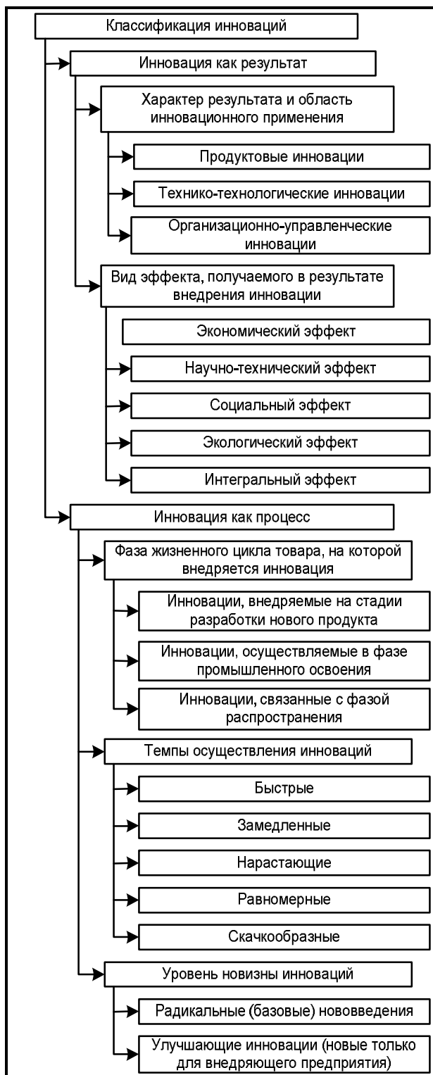
Рис. 1. Классификация инноваций и характеристика классификационных признаков

Классификация инноваций и характеристика классификационных признаков приведена на рис. 1.