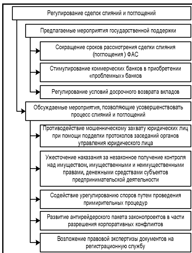
Рис. 2. Мероприятия по регулированию сделок слияний и поглощений

В целом мероприятия государственной поддержки сделок слияний и поглощений можно представить в виде схемы (рис. 2).