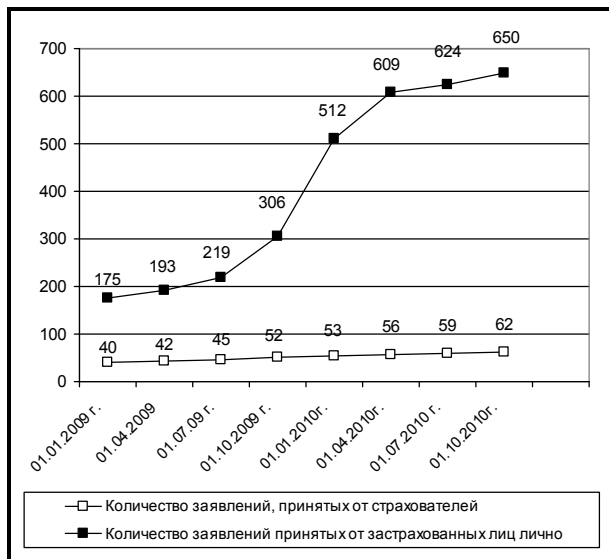
Рис. 2. Динамика приема заявлений на добровольное пенсионное страхование с 01.01.2009 по 01.10.2010 г. в Управлении ПФ г. Перми

полнительных страховых взносов на накопительную часть трудовой пенсии за период с 01.01.2009 г. по 01.10.2010 г. Наибольшее число заявлений от застрахованных лиц приходится на 4 квартал 2009 года. За этот период в программу вступили 206 застрахованных лиц, или 28, 93% от общего количества вступивших в данную программу. Стоит отметить, что застрахованные лица предпочитают лично обращаться в Управление ПФ, а не через работодателя.