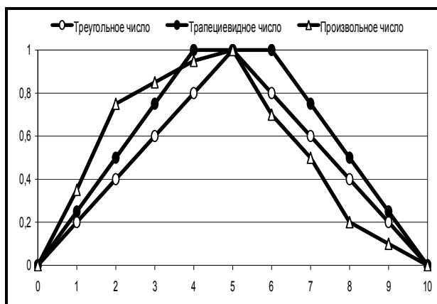
Рис. 2. Основные типы линейаризованного представления нечетких чисел

Множество пар чисел (y_i; \mu(y_i)), i = 1, 2, \dots , упорядоченное по возрастанию: y_1 < y_2 < y_3 < \dots