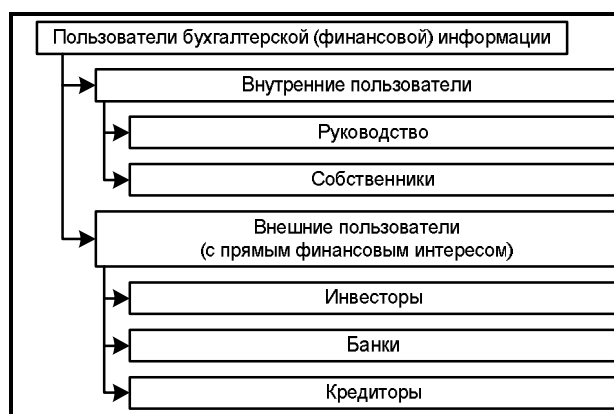
Рис. 1. Классификация пользователей бухгалтерской (финансовой) информации

В целях разработки методики экспресс-анализа для отдельных категорий пользователей мы будем использовать их классификацию, представленную на рис. 1.