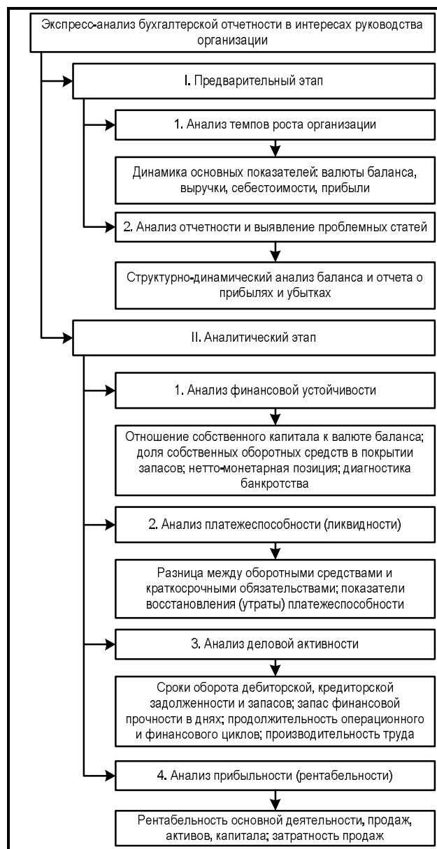
Рис. 2. Схема экспресс-анализа в интересах руководства организации

совой устойчивости, так как он предполагает оценку способности и возможности организации эффективно использовать средства и своевременно погашать все свои долги, и деловой активности как оценки эффективности использования организацией ресурсов.