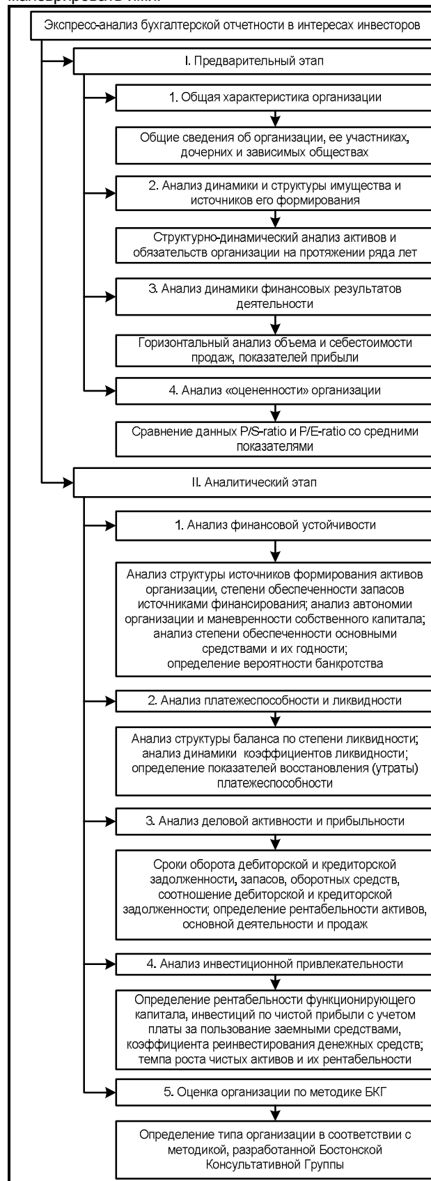
Рис. 4. Схема экспресс-анализа в интересах инвесторов

мобильной форме, что позволяет относительно свободно маневрировать ими.