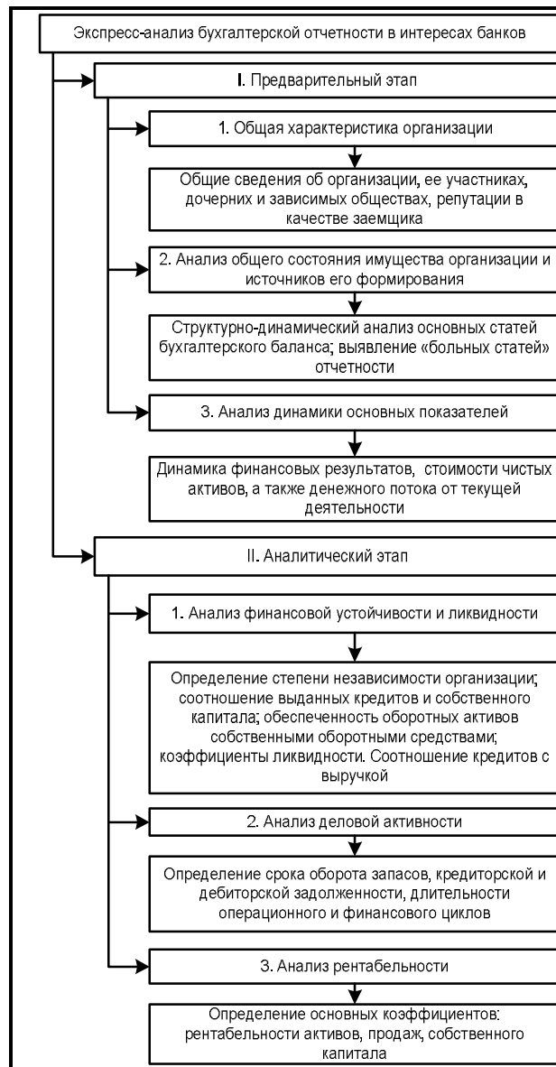
Рис. 6. Схема экспресс-анализа в интересах банков

Также целесообразно проанализировать денежный поток от текущей деятельности, формируемый как сумма чистой прибыли, амортизации и прироста кредиторской задолженности за вычетом прироста дебиторской задолженности и прироста запасов. Очевидно, что кредитоспособная организация должна характеризоваться устойчивым потоком от текущей деятельности, при этом величина кредита зачастую определяется величиной денежного потока.