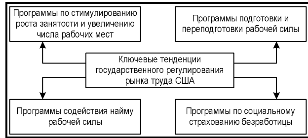
Рис. 2. Целевые программы по регулированию рынка труда США

четыре ключевых тенденции государственного регулирования рынка труда США (рис. 2).