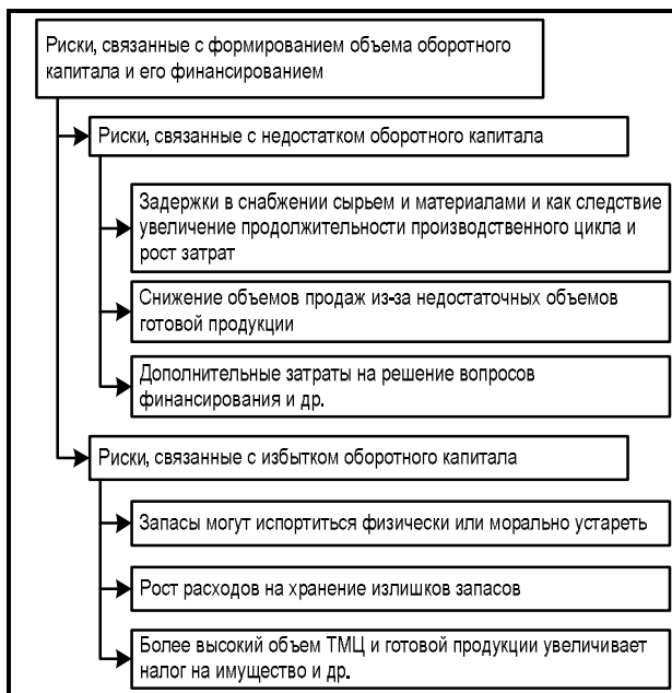
Рис. 2. Риски, связанные с формированием объема оборотного капитала и его финансированием

В системе управления воспроизводством оборотного капитала важную роль играет оценка рисков, связанных с формированием объема оборотного капитала и их финансированием. В зависимости от избытка или недостатка оборотного капитала можно выделить следующие группы рисков (рис. 2).