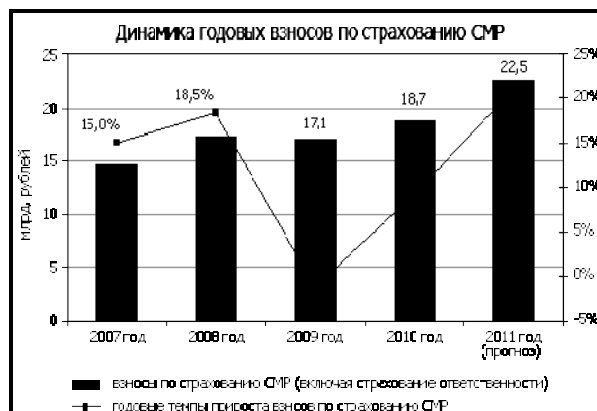
Рис. 2. Динамика годовых взносов по страхованию строительно-монтажных рисков [13]

По данным «Эксперта РА», в 2010 году по сравнению с 2009 годом рынок страхования строительно-монтажных рисков (далее – СМР) вырос на 9%, до 18,7 млрд. рублей. Основной составляющей роста стали целевые госинвестиции в масштабные инфраструктурные проекты в Сочи, Владивостоке и Казани, которые требуют развития инфраструктуры и гражданского строительства. Строительная индустрия, не связанная с этими объектами, растет гораздо медленнее, хотя и происходит посткризисное оживление в кредитовании, «размораживаются» остановленные в кризис объекты. При условии стабильности макроэкономических показателей и реализации тех проектов, под которые сейчас создаются государственные программы, независимо от схемы их финансирования, прогнозируется рост рынка на уровне 21% в 2011 году [13].