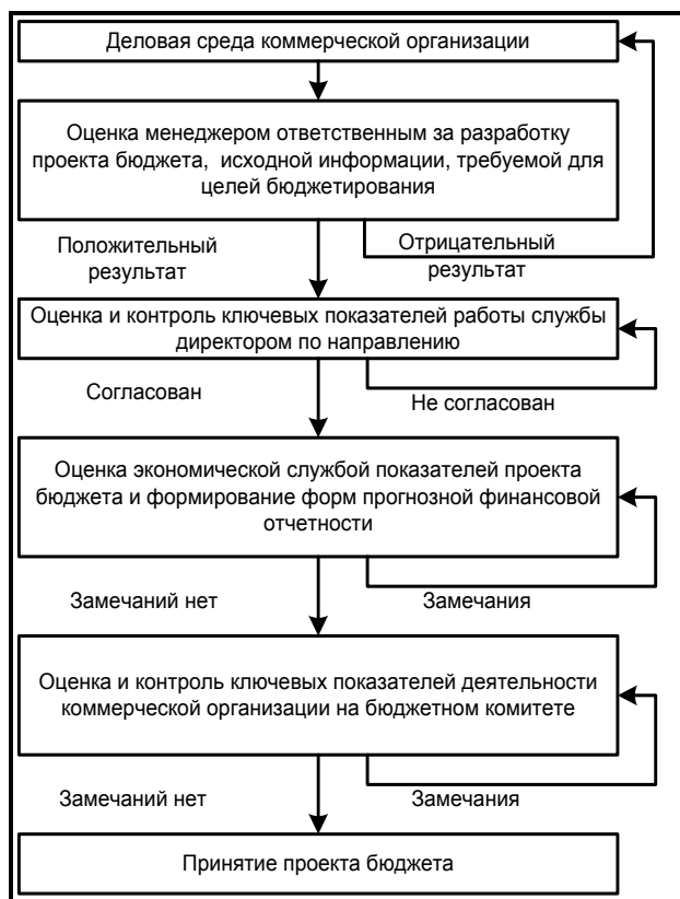
Рис. 2. Этапы организации системы внутреннего контроля формирования прогнозной финансовой отчетности в рамках системы бюджетирования

модействие всех элементов подразумевает наличие правил, методик, положений и документации, регламентирующий бюджетный процесс и процесс формирования форм прогнозной финансовой отчетности. Предлагается организация системы контроля формирования прогнозной финансовой информации в виде этапов, представленных на рис. 2.