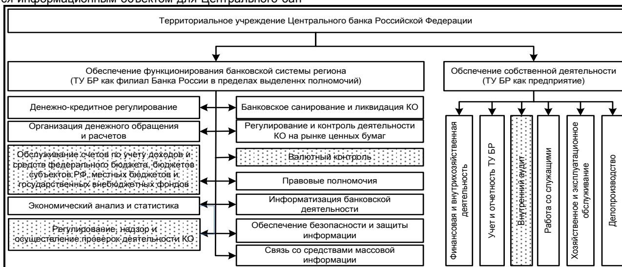
Рис. 1. Задачи и функции территориального учреждения ЦБ РФ [1]

При этом на рис. 1 мы выделили функции (штриховка), которые на текущий момент утрачивают для ТУ свою актуальность (частично или полностью), несмотря на то, что в нормативном документе [1] эти функции названы, либо же они трансформировались в другие задачи в связи с изменением законодательства.