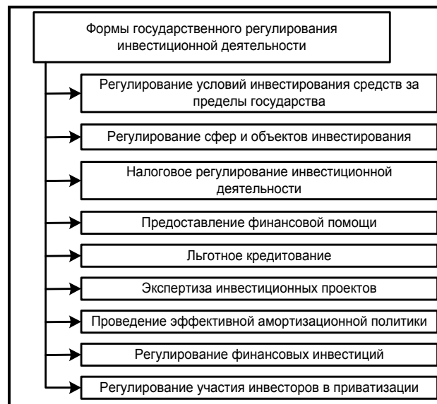
Рис. 1. Основные формы государственного регулирования инвестиционной деятельности

Регулирование выражается в прямом управлении государственными инвестициями: системе налогов с дифференцированием налоговых ставок и налоговых льгот, финансовой помощи в виде дотаций, субсидий, бюджетных ссуд, льготных кредитов, в финансовой и кредитной политике, ценообразовании, выпуске в обращение ценных бумаг, амортизационной политике.