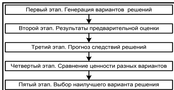
Рис. 2. Принцип поэтапного преодоления неопределенностей в система экономической безопасности

В основе формирования предпринимательского решения лежит принцип поэтапного преодоления неопределенностей (рис. 2), с которыми сталкиваются участники выработки и принятия решений в системе обеспечения экономической безопасности.