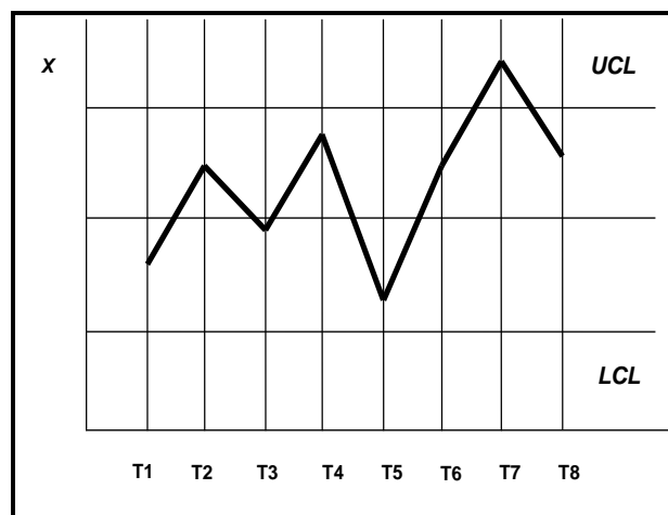
Рис. 1. Контрольная карта