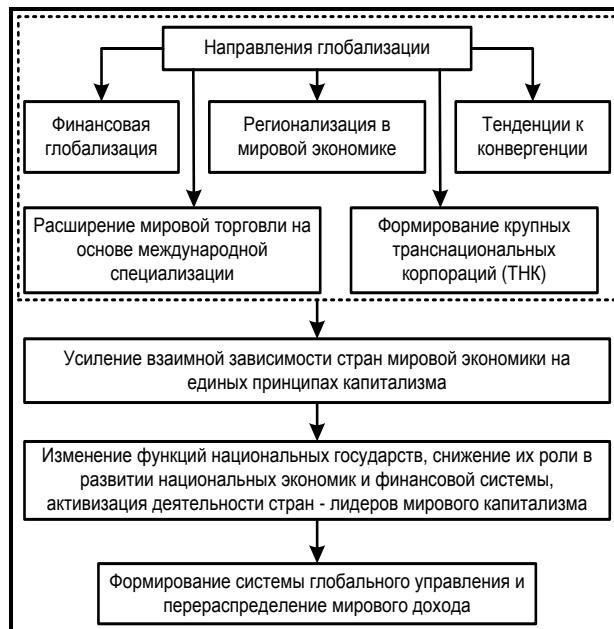
Рис. 1. Перераспределительные процессы в условиях глобализации

Такие процессы глобализации приводят к усилению экономической и финансовой взаимозависимости стран мира, развивающихся на основе единых принципов капитализма. Причем функции и роль национальных государств в развитии национальных экономик и финансовых систем изменяются, усиливается влияние стран – лидеров мирового капитализма (рис. 1).