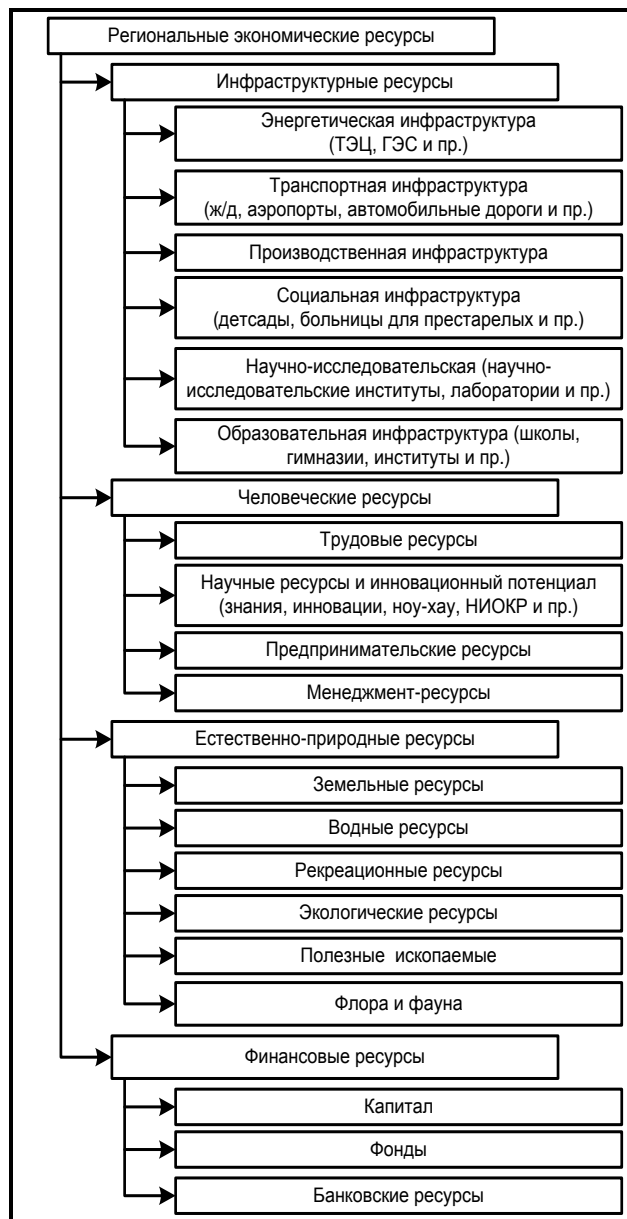
Рис. 1. Структура региональных экономических ресурсов

Обобщив взгляды экономистов, структуру региональных экономических ресурсов можно представить следующим образом (рис. 1).