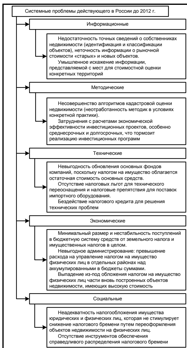
Рис. 2. Системные проблемы действующего в РФ до 2012 г. порядка имущественного налогообложения

На наш взгляд, при переходе к уплате нового налога налоговая и бухгалтерская практика столкнется с множеством проблем, решение которых упирается в определение стоимости для целей налогообложения, основная из которых связана с соответствием государственной кадастровой стоимости рыночной. Те же проблемы не устранены при определении стоимости строящегося объекта, эксплуатируемая часть которого приносила доход, например, по договору аренды при исчислении действующего на сегодня налога на имущество организаций. Практики часто затруднялись с расчетом среднегодовой стоимости такого объекта при формировании базы по налогу на имущество организаций. Кроме того введение нового налога сопряжено с социальными проблемами, а именно – увеличением налоговой нагрузки на собственников типовых квартир.