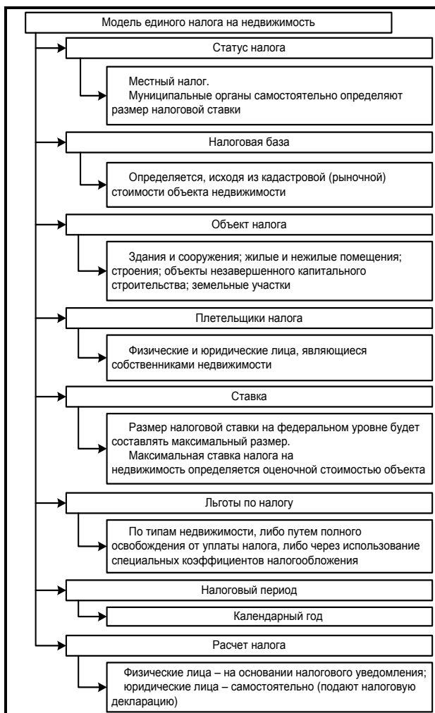
Рис. 3. Модель единого налога на недвижимость

множества проблем в рамках действующей системы имущественного налогообложения ставит под сомнение успешное функционирование нового ЕНДЖ даже в форме концепции Правительства РФ. На наш взгляд, сама перспектива реформы налогообложения недвижимости не опирается на сущностные основы налога как регулятора экономического роста.