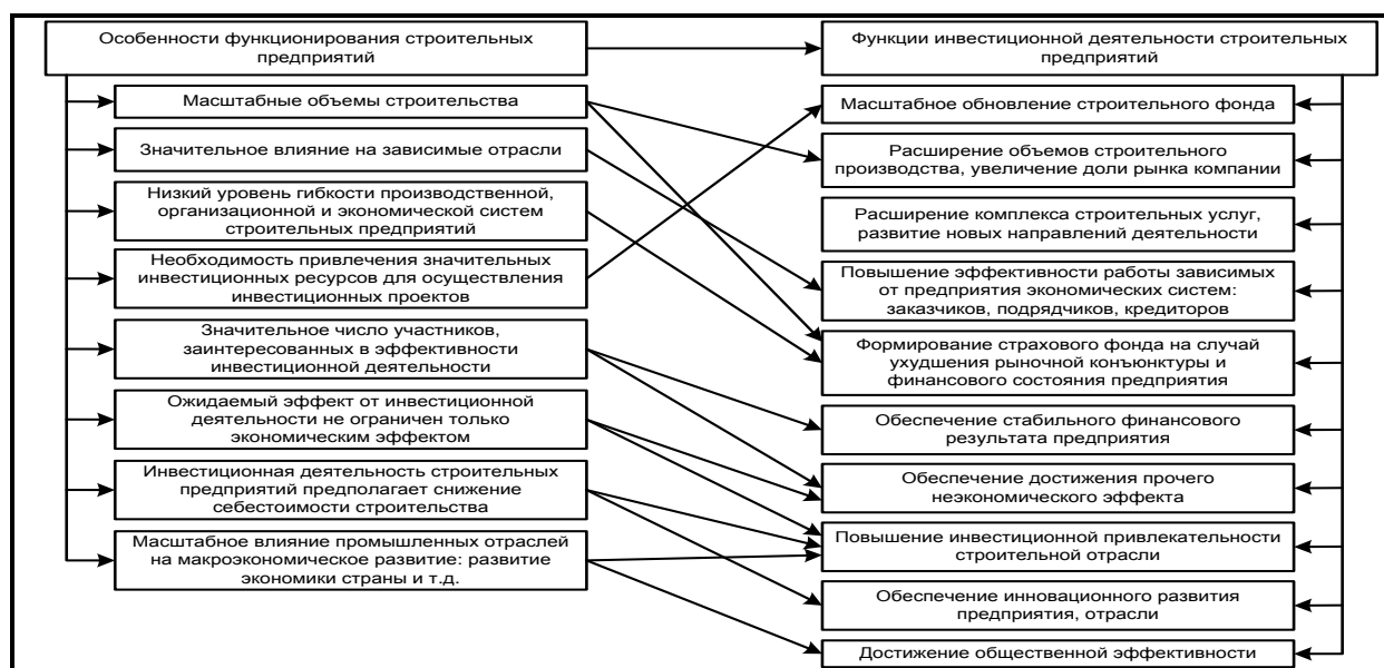
Рис. 1. Зависимость функций ИД строительного предприятия от особенностей функционирования в рамках отрасли

CIF , cash inflow – поступающие денежные потоки;