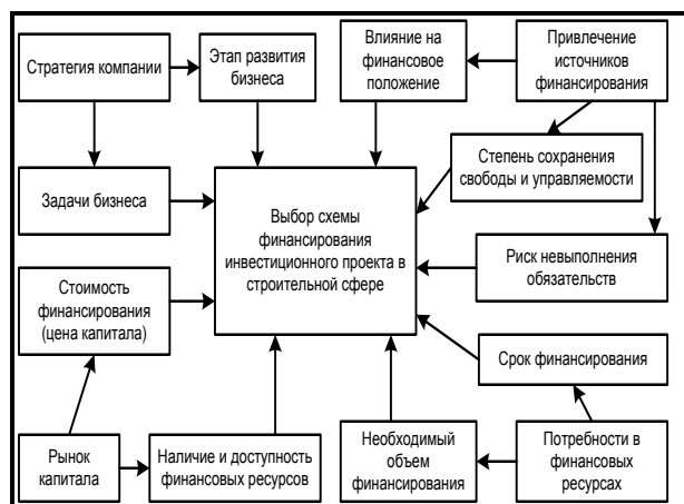
Рис. 3. Факторы выбора схемы финансирования инвестиционных проектов в строительной сфере