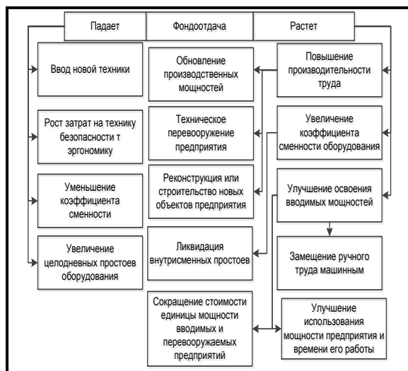
Рис. 3. Факторы, влияющие на изменение фондоотдачи

Причины роста и снижения фондоотдачи в общем виде можно представить на рис. 3.