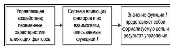
Рис. 1. Работа результатов мониторинга региональной политики

Работу экономического механизма реализации мониторинга региональной политики управления можно изобразить в виде следующей схемы (рис. 1.)