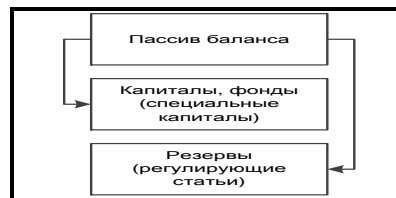
Рис. 2. Структура пассива баланса за исключением обязательств

ства у нас вынесены в правую часть, поэтому остаются три составляющие (рис. 2).