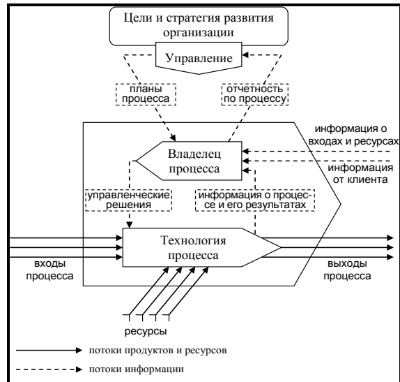
Рис. 3. Информационное обеспечение управления бизнес-процессом

Процессный подход к организации аудита требует, чтобы в системе управления организацией формировалась информация о ходе процесса, его поставщиках, потребителях и других элементах, которая используется владельцем процесса и руководством. Информационное обеспечение управления бизнес-процессом представлено на рис. 3.