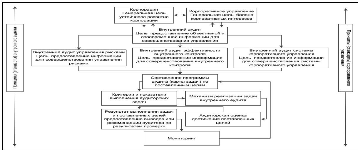
Рис. 2. Концептуальная схема внутреннего аудита в системе корпоративного управления

Понимание сложной системы протекающих в организации процессов корпоративных отношений и взаимосвязей между ними позволяет компании достигать поставленных целей (рис. 2). В ряде публикаций авторы раскрывают понятие «аудит корпоративного управления» («корпоративный аудит») как регулярное проведение оценки уровня соответствия корпоративного управления процедурам требований нормативно-правовых актов и внутренних документов (регламентов) корпорации. Исходя из того, что аудит корпоративного управления (корпоративный аудит) является одним из основных направлений внутреннего аудита, дадим следующее его определение: аудит корпоративного управления – комплекс контрольно-аналитических процедур по независимой, объективной оценке и верификации соответствия основных компонентов корпоративных отношений и их эффективности установленным критериям на основе действующего законодательства, внешних и внутренних регламентов (стандартов) и существующей практики с учетом социальной ответственности бизнеса.