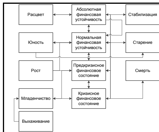
Рис. 3. Параметры финансового состояния и их влияние на фазы жизненного цикла организационной системы

Механизм трансформации этапов жизненного цикла под воздействием параметров финансового состояния представлен на рисунке 3. Следовательно, можно сделать вывод о том, что модель жизненного цикла не существует сама по себе, она характеризуется конкретными показателями, и что самое главное может иметь абсолютно контролируемое, в соответствии с целевыми установками, траекторию развития при условии грамотного управления финансовыми ресурсами