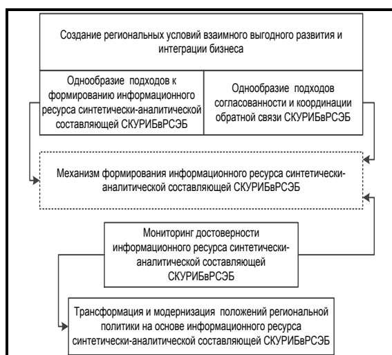
Рис. 5. Механизм формирования информационного ресурса синтетически-аналитической составляющей СКУРИБвРСЭБ

На первых четырех этапах методике СКУРИБвРСЭБ проходят периоды генезиса, освоения, реализации и анализа действенности региональной политики развития и интеграции различных форм предпринимательства в системе экономической безопасности. Четыре временные фазы включаются в пятую – трансформация и модернизация по результатам СКУРИБвРСЭБ-5 для принятия корректирующих управленческих решений (рис. 6). В методике СКУРИБвРСЭБ критериями временной эффективности будет являться минимальная продолжительность первых трех периодов и максимум длительности четвертого периода ((СКУРИБвРСЭБ-1 + СКУРИБвРСЭБ-2 + СКУРИБвРСЭБ-3) ≤ СКУРИБвРСЭБ-4). Также, важным является непрерывность пятого периода СКУРИБвРСЭБ-5, который включается и сопровождает четыре начальных периода, что позволит выявлять и формировать меры координации (1):