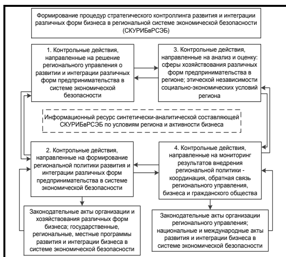
Рис. 4. Механизм применения процедур СКУРИБвРСЭБ организационной составляющей региональной политики развития и интеграции различных форм предпринимательства в системе экономической безопасности

Механизм формирования информационного ресурса синтетически-аналитической составляющей СКУРИБвРСЭБ представлен на рис. 5.