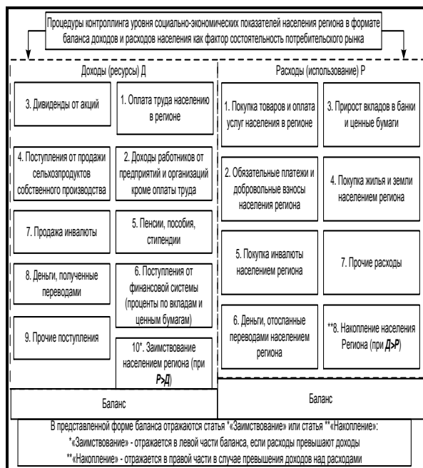
Рис. 2. Процедуры контроллинга уровня социально-экономических показателей региона как фактора состоятельности потребительского рынка для развития бизнеса в формате баланса доходов и расходов населения 1