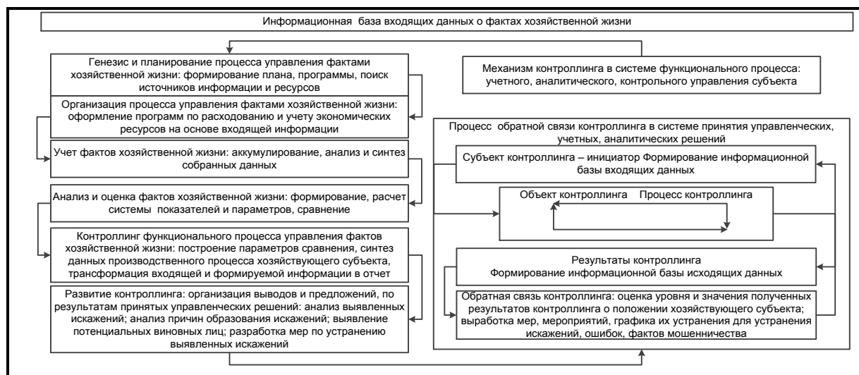
Рис. 2. Механизм контроллинга в системе функционального учетного, аналитического и контрольного процессов

Предпринимательская деятельность российских хозяйствующих субъектов в условиях рынка, их уязвимость при воздействии внешних и внутренних угроз ведут к снижению экономической устойчивости [13]. Данное обстоятельство свидетельствует о необходимости создания в субъектах предпринимательства системы контроллинга, ориентированной на построение механизма высокого уровня защиты, ресурсосбережения на основе сочетания правовых, экономических, технических инструментов для снижения риска потери экономических ресурсов, а также повышения финансовой устойчивости и доходности.