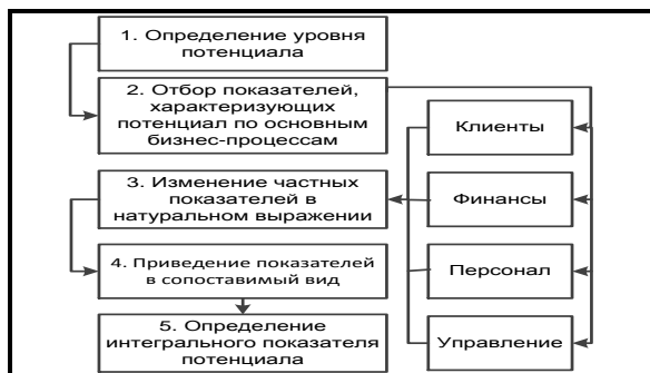
Рис. 4. Этапы анализа потенциала организаций ДОСААФ России

Анализ величины потенциала хозяйствующего субъекта сводится к оценке максимального количества благ, которые экономический субъект способен произвести при данном количестве, качестве ресурсов. Такой анализ базируется на таких предпосылках: