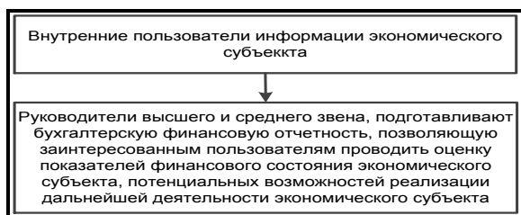
Рис. 2. Внутренние пользователи финансовой отчетности

Необходимо заметить, что для разных групп пользователей наполнение анализа бухгалтерской финансовой отчетности будет различным. Он всецело будет зависеть от конкретно поставленной цели при его проведении. Одних пользователей бухгалтерской финансовой отчетности будет интересовать финансовая устойчивость анализируемого экономического субъекта, других прибыльность, кого-то полная оценка финансового состояния экономического субъекта как элементов его экономического потенциала.