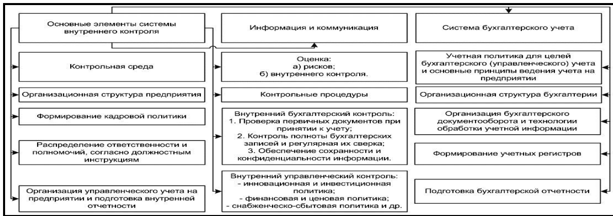
Рис.1. Основные элементы формирования системы внутреннего контроля на предприятии