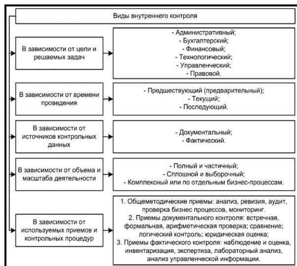
Рис. 2. Основные виды внутреннего контроля

Порядок формирования и организации внутреннего контроля на предприятии определяются в зависимости от характера и масштабов ее деятельности, особенностей ее системы управления. При этом необходимо учитывать, что внутренний контроль должен быть организован во всех подразделениях предприятия, на всех его уровнях, в контрольных процедурах должны участвовать все сотрудники в соответствии с их полномочиями и сферой ответственности. Внутренний контроль, как правило, осуществляют органы управления организации, ревизионная комиссия (ревизор), главный бухгалтер или иное должностное лицо организации, на которое возлагается ведение бухгалтерского учета, внутренний аудитор (служба внутреннего аудита) и другой персонал [6, с. 312].