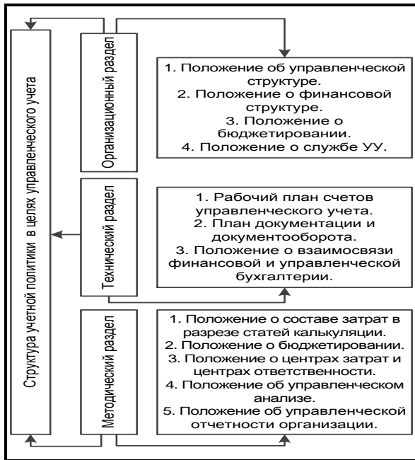
Рис. 2. Структура УПУУ коммерческой организации

сообразных классификаций, то вероятность существенной ошибки минимальна.