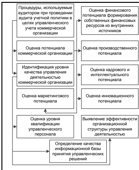
Рис. 3. Процедуры, используемые аудитором при проведении аудита УПУУ коммерческой организации

В процессе проведения аудита УПУУ коммерческой организации аудитор должен решить следующие задачи.