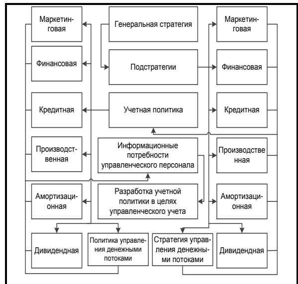
Рис. 1. Алгоритм формирования УПУУ

Все это в совокупности должно быть направлено на удовлетворение информационных потребности управленческого персонала коммерческой организации.