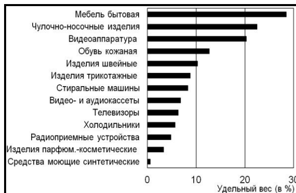
Рис. 1. Удельный вес некачественных непродовольственных товаров, поставляемых по импорту на потребительский рынок РФ в 2013 г. [8]

В качестве аргумента в пользу необходимости широкого использования товароведной экспертизы в торговой практике приведем следующий факт. На рис. 1 показаны удельные веса некачественных непродовольственных товаров различных групп, поставки по импорту которых были осуществлены в 2013 г. Ситуация с поставками отечественных товаров практически аналогична. Однако есть и серьезные отступления от требований государственных стандартов. В частности, более 25% поставок отечественных моющих синтетических средств являются некачественными. Очевидно, что контроль товаров в процессе их приемки по количеству и качеству на предприятиях оптовой и розничной торговли играет существенную роль в их хозяйственной деятельности и, соответственно, в обеспечении их конкурентоспособности.