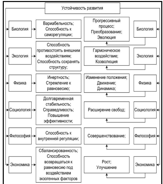
Рис. 2. Основные характеристики понятия «устойчивость развития», применяемые в различных областях знаний

В совокупности перечисленные свойства стали основой идеи применения понятия устойчивого развития в наиболее значимой для мирового сообщества сфере взаимодействия человека и окружающей среды. Следует признать, что на сегодняшний день Концепция устойчивого развития, представляющая собой конгломерат философских, экологических, социально-политических, экономических, технических и прочих идей, не отличающихся единством. Но, поскольку благополучие человечества напрямую связано с его благосостоянием, то во взаимоотношения человека и природы вмешалась еще одна составляющая – экономическая.