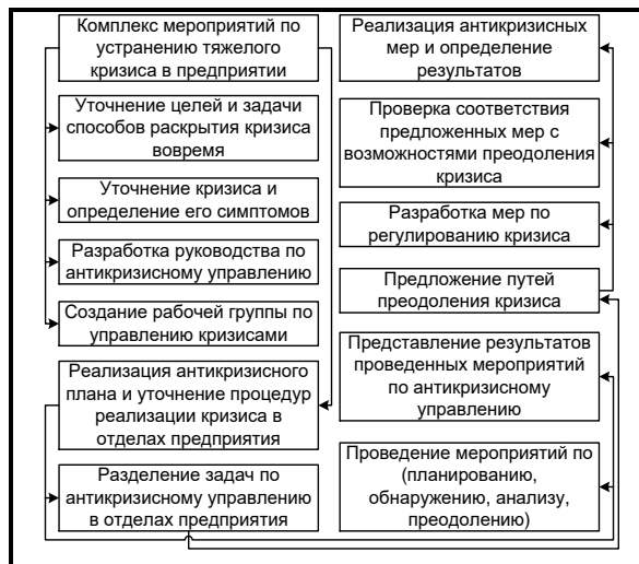
Рис. 2. Комплексные меры, направленные на финансовую стабилизацию предприятия

финансовым обязательствам. Для этого необходимо сократить производственные расходы предприятия, число рабочих и т.д. Кроме того, необходимо принять меры по повышению ликвидности деятельности предприятия.