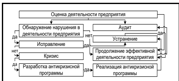
Рис. 1. Система экспресс-диагностики угрозы кризиса в предприятии

Предложенная система экспресс диагностики кризиса в предприятиях позволяет регулярно проводить оценку деятельности предприятия, своевременно выявить вероятность кризиса и принять меры по его устранению. Система экспресс-диагностики угрозы кризиса в предприятии измеряет факторы, которые являются уязвимыми к кризису в предприятиях. К этим факторам относятся: производство, маркетинг, человеческие ресурсы, научные исследования и разработки, финансы предприятия и система управления. Данная система позволяет прогнозировать возможности наступление кризиса заранее, предотвращать банкротства и или уменьшение убытков предприятия от наступления кризиса, минимизация риска кризиса и продолжение бизнеса пострадавших от кризиса.