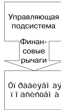
Рис. 1.1. Основные подсистемы предприятия

Предприятие как система состоит из двух подсистем: управляющей и управляемой (см. рис. 1.1).