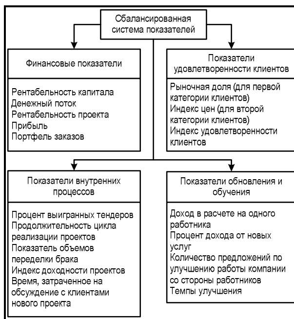
Рис. 2. Сбалансированная система показателей 21

Стоимостная концепция управления начала формироваться в экономике США в конце 1980-х гг. В последнее время методики оценки стоимости бизнеса распространились и в отечественной экономике, но основной задачей определения рыночной стоимости стало урегулирование отношений собственности: для целей стратегического управления в настоящее время разработок явно недостаточно. Основные положения стоимостной концепции нашли отражение и развитие в трудах Коупленда Т., Коллера Т., Муррина Д., Уолша К., Скотта М. 23, 24, 25