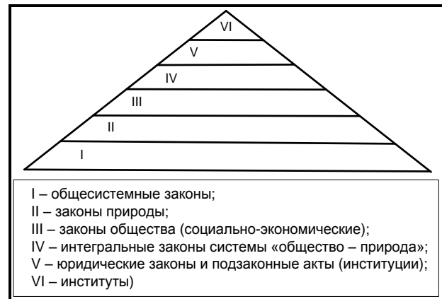
Рис. 2. Соотношение объективных закономерностей в материальном мире и управленческой системе 2

Изучение законов природопользования и позволяет выработать механизмы взаимоувязки принципов (законов) природопользования, восходящих от уровня к уровню (рис. 2).