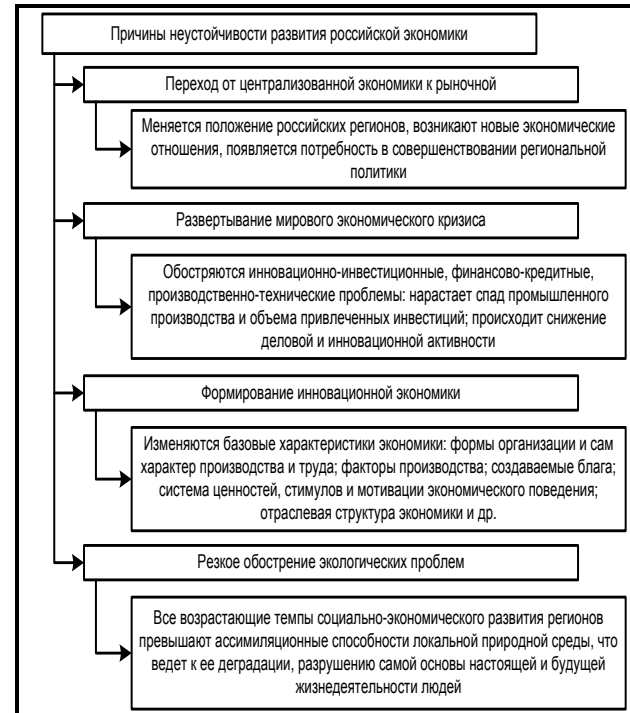
Рис. 2. Проблемы устойчивости развития российской экономики [4]

Проблеме устойчивого развития в нашей стране посвящен целый ряд монографий и научных пособий, усиленно внедряемых современной системой образования.