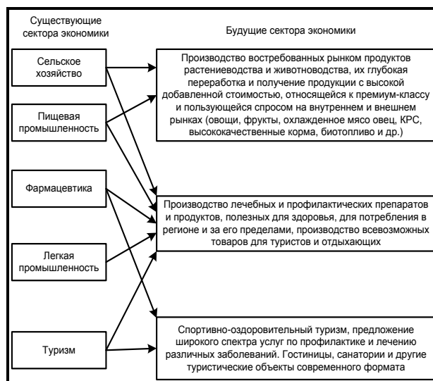
Рис. 2. Схема секторов экономики будущих отраслей и их деятельности 2