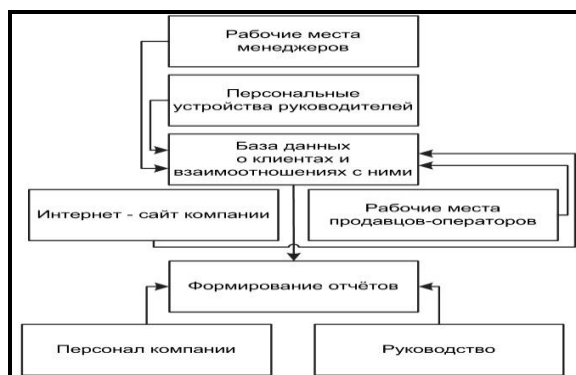
Рис. 3. Информационная система компании

При внедрении CRM-концепции в хозяйственную деятельность компании необходимо придерживаться следующих общепринятых принципов, которые позволят эффективно внедрить и использовать CRM-концепцию в хозяйственной деятельности компании.