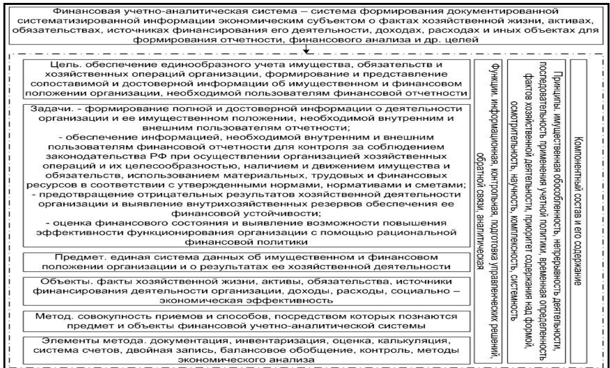
Рис. 2. Концептуальные положения ФУАС