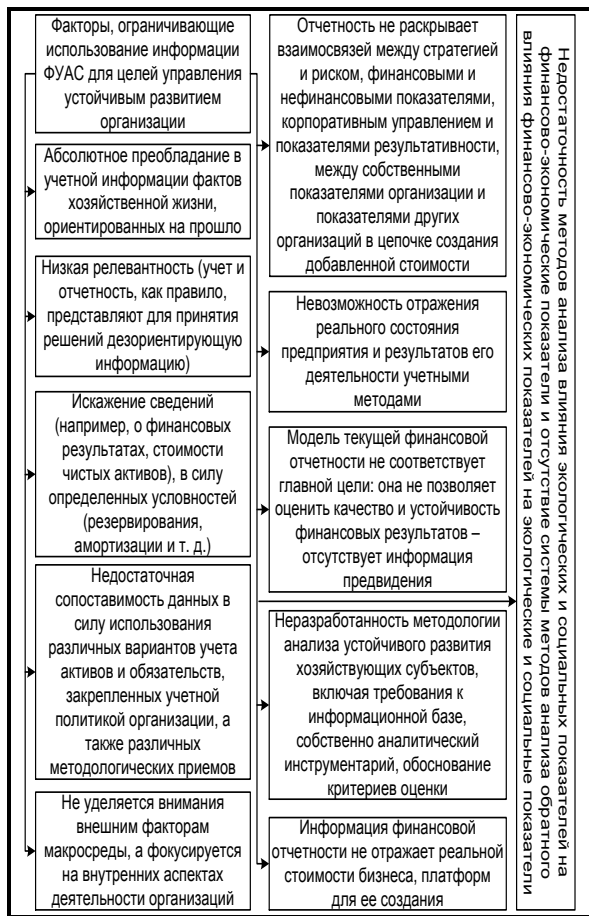
Рис. 4. Факторы, ограничивающие использование информации ФУАС для целей управления устойчивым развитием организации

К такой информации относится, прежде всего, информация о финансовом состоянии организации, результатах ее деятельности, что дает возможность пользователям оценить как прошедшие экономические явления, так и будущие перспективы развития организации. Субъекты управления, используя учетно-аналитическую информацию ФУАС для целей управления устойчивым развитием организации, должны данную информацию интерпретировать в целях принятия управленческих решений с учетом методологии ее формирования и пониманием реальных возможностей ФУАС. При отсутствии постановки конкретных целей и задач к ФУАС со стороны субъектов управления, цель ФУАС смещается на формальную ее организацию в соответствии с требованиями законодательно-нормативных документов. Данный подход в определенной степени обусловлен наличием в учетной практике организаций системы управленческого учета, который, по мнению руководителей, и является информационной системой для целей управления устойчивым развитием организации. Однако утверждение о том, что финансовый учет не служит целям управления устойчивым развитием организации лишь потому, что есть еще управленческий учет, формирующий информацию для управления, является ошибочным, поскольку финан-