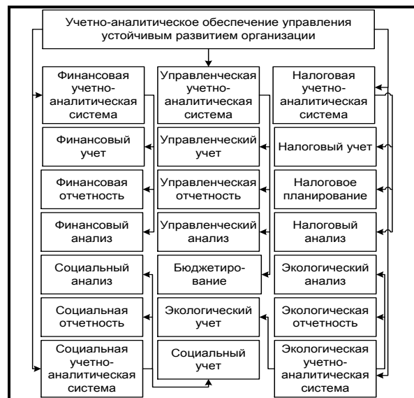
Рис. 1. Компонентный состав учетно-аналитического обеспечения управления устойчивым развитием организации

Вследствие вышеизложенного считаем вполне обоснованным для целей управления устойчивым развитием организации расширить границы его информационного обеспечения, выделив финансовую учетно-аналитическую, управленческую учетно-аналитическую, налоговую учетно-аналитическую, социальную учетно-аналитическую и экологическую учетно-аналитическую системы. Необходимость выделения отдельных учетно-аналитических систем обусловлена потребностями определенных групп пользователей в информации и, как следствие, целевая направленность выделенных учетно-аналитических систем разная. Исходя из целевого назначения и специфики учетно-аналитической информации, формируются концептуальные модели построения выделенных учетно-аналитических систем, определяются особенности методики и организации. Компонентный состав учетно-аналитического обеспечения управления устойчивым развитием организации представлен на рис. 1.